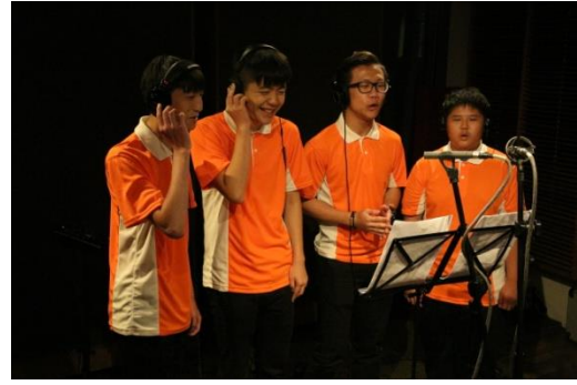
本校無伴奏合唱團為本堂堂歌進行錄音