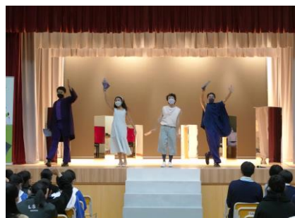
藝術節青少年之友計劃 音樂劇場演出