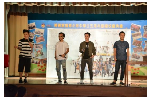
全方位活動 - 音樂分享