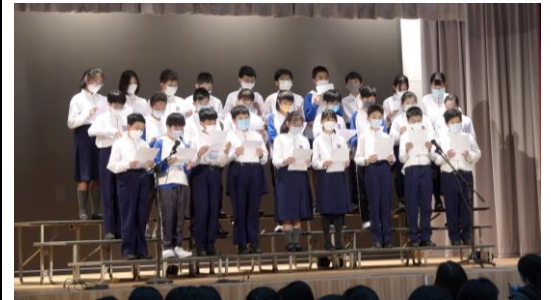
跨學科活動 - 中一級普通話歌唱