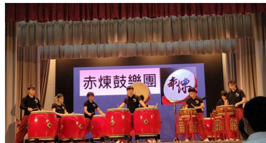
全方位活動 - 校外音樂團體到校演出